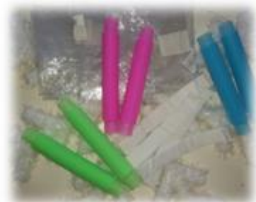
ПОПИТ, КОНТАКТНАЯ ЛЕНТА И ПАКЕТ ШУРШАЩИЙ ДЛЯ МУЗЫКАЛЬНОЙ ИМИТАЦИИ ЗИМНИХ ЗАБАВ