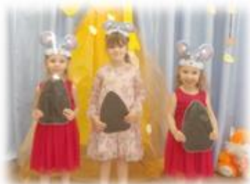
ШУРШАЩИЕ СЕМЕЧКИ ДЛЯ МЫШЕК

Хотелось бы отметить, что исследовательская технология в работе музыкального