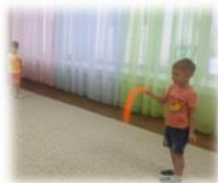
ДОБЫВАНИЕ ВЕТРА С ГОФРИРОВАННОЙ ТРУБОЙ