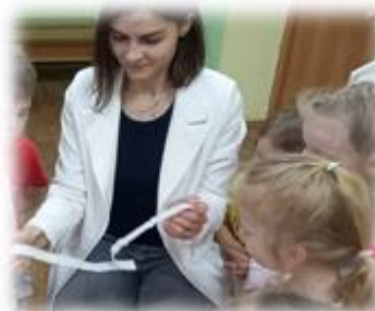
СОВМЕСТНОЕ ИЗГОТОВЛЕНИЕ ДШИ ДЛЯ ЭЛЕМЕНТАРНОГО МУЗИЦИРОВАНИЯ

руководителя в ДОУ позволяет решать следующие развивающие задачи: